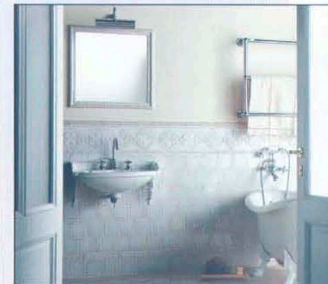
Badanwendung: Uni-Fliesen „Opale“ (Rosa-Cotto), farbgleiche Dekorfliesen „Merletto“ und Bordüren in drei Formaten.

Weder modern noch minimalistisch: Die Fliesenkollektion „Vecchie Majoliche“ des italienischen Hersteller Ceramiche Grazia erinnert an keramische Wandbeläge längst vergangener Zeiten, die durch kleine Formate, handgeformte Oberflächenstrukturen, zeitlose Farben und kunstvolle Dekore für lebendige und ausdrucksstarke Raumgestaltungen sorgen. Für die individuelle Wandgestaltung bietet die Serie vier hochglänzende Uni-Fliesen mit einer edlen Handform-Oberflächenstruktur (Format 13 x 13 cm) in den Farben Ghiaccio (Altweiß), Orca (Zartgelb), Giada (Zartgrün) und Opale (Rosa-Cotto). Dazu zwölf ornamental gestaltete Relief-Dekorfliesen im gleichen Format, deren Farbgebung den Uni Fliesen entsprechen und eine Vielzahl von Relief-Bordüren mit unterschiedlichen Dekormotiven in unterschiedlichen Ausbildungen, Breiten