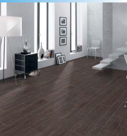
Holzinterpretationen sind häufig die bessere Wahl: Schön wie das Original – verbunden mit der Pflege- und Widerstandsfähigkeit von Keramik. Unter auf der Fußbodenheizung bleiben Fliesen das Non-plus-ultra (»Caudex«, Agrob Buchtal).