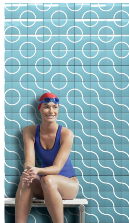
»Chroma Play!« ist genial einfach bzw. einfach genial, denn das geometrischen Stilmittel »Viertelkreis« offeriert unendlich viele Anordnungsmöglichkeiten: ob Kreis, wellenförmiges Gebilde oder Schlangenlinie (Agrob Buchtal). Mit dieser Architekturkeramik freuen sich auch zunehmend private Bauherren an.

ehemalige »große« Format 30 x 60 cm ist heute Standard, bei der architektonisch anspruchsvollen Bodengestaltung geht der Trend in Richtung XXL-Fliesen: Kantenlängen von 60 cm sind mittlerweile verbreitet, Kantenlängen bis zu 120 cm, die bislang hauptsächlich im Objektbereich dominierten, sind auch im privaten Wohnbereich im Kommen. Sowohl das klassische quadratische