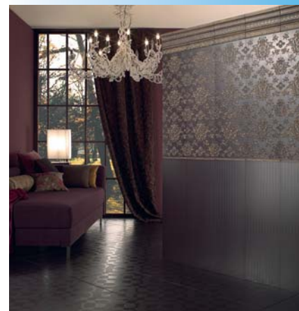
»La Diva« vermittelt ein Raumgefühl, das vornehm, mondän und gleichzeitig auf sehr noble Art dezent ist (Villeroy & Boch).