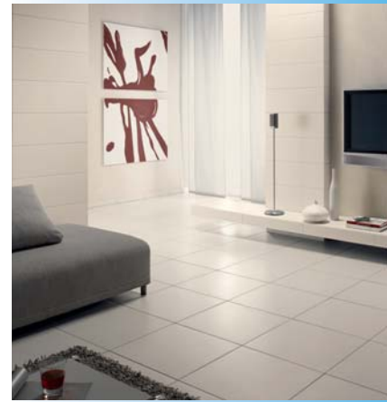
An Wand und Boden überzeugt das moderne Querformat – und ist als geflieste Konsole unter dem Fernseher nicht nur ein Hingucker, sondern auch überaus praktisch (Steuler).

Die »dreidimensionalen« Oberflächen sprechen die Sinne an und erschließen keramischen Wand- und Bodenbelägen dadurch zahlreiche neue Anwendungsgebiete im gesamten Wohnbereich. ●