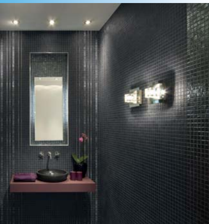
»Natural Glamour« zaubert mit Matt-Glanz-Effekt eine moderne, zeitlos schöne und zugleich dezent elegante Raumatmosphäre – einsetzbar im gesamten Wohnbereich (Jasba).