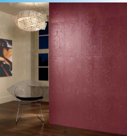
Die Mikrorelief-Oberfläche von »Twilight« sorgt mit Wechselspiel von Licht und Schatten und seidig-changierenden Farben für eine einzigartige, geheimnisvolle Raumwirkung (Villeroy & Boch).